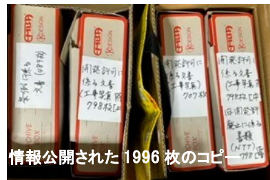
情報公開された1996枚のコピー

1～3月 医療受診実績 辻堂金沢内科クリニック 6回、 やの歯科 5回、マリツ整形外科 1月21日～4月30日 12回、辻堂南口耳鼻科 2回、星野眼科 1回、茅ヶ崎中央病院 2回+入院手術 5日間、介護保険ヘルパ-週1来宅、ケアマネ 1回来宅